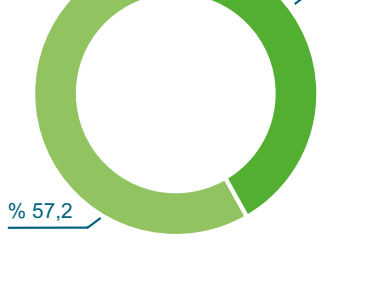
Vonovia yeşil elektrik (ürün karışımı)

CO 2 emisyonları: 0,0000g/kWh Radyoaktif atıklar: 0,0000g/kWh